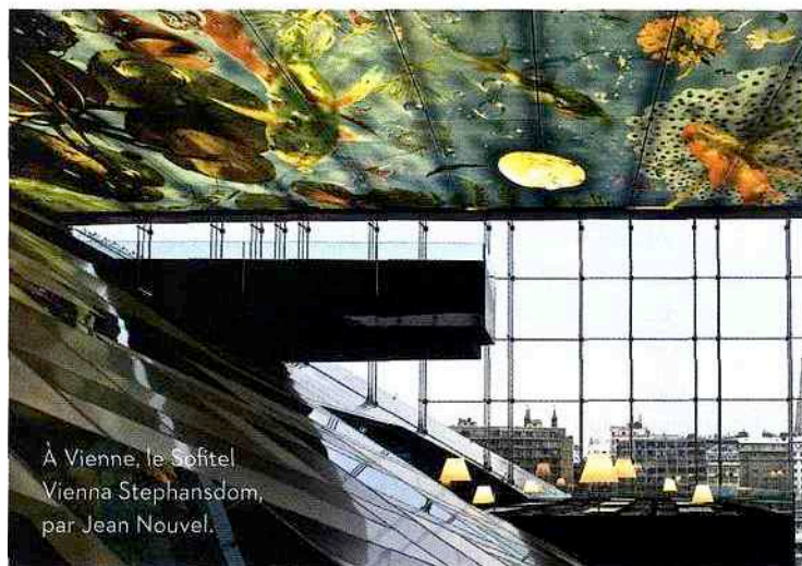
À Vienne, le Sofitel Vienna Stephansdom, par Jean Nouvel.