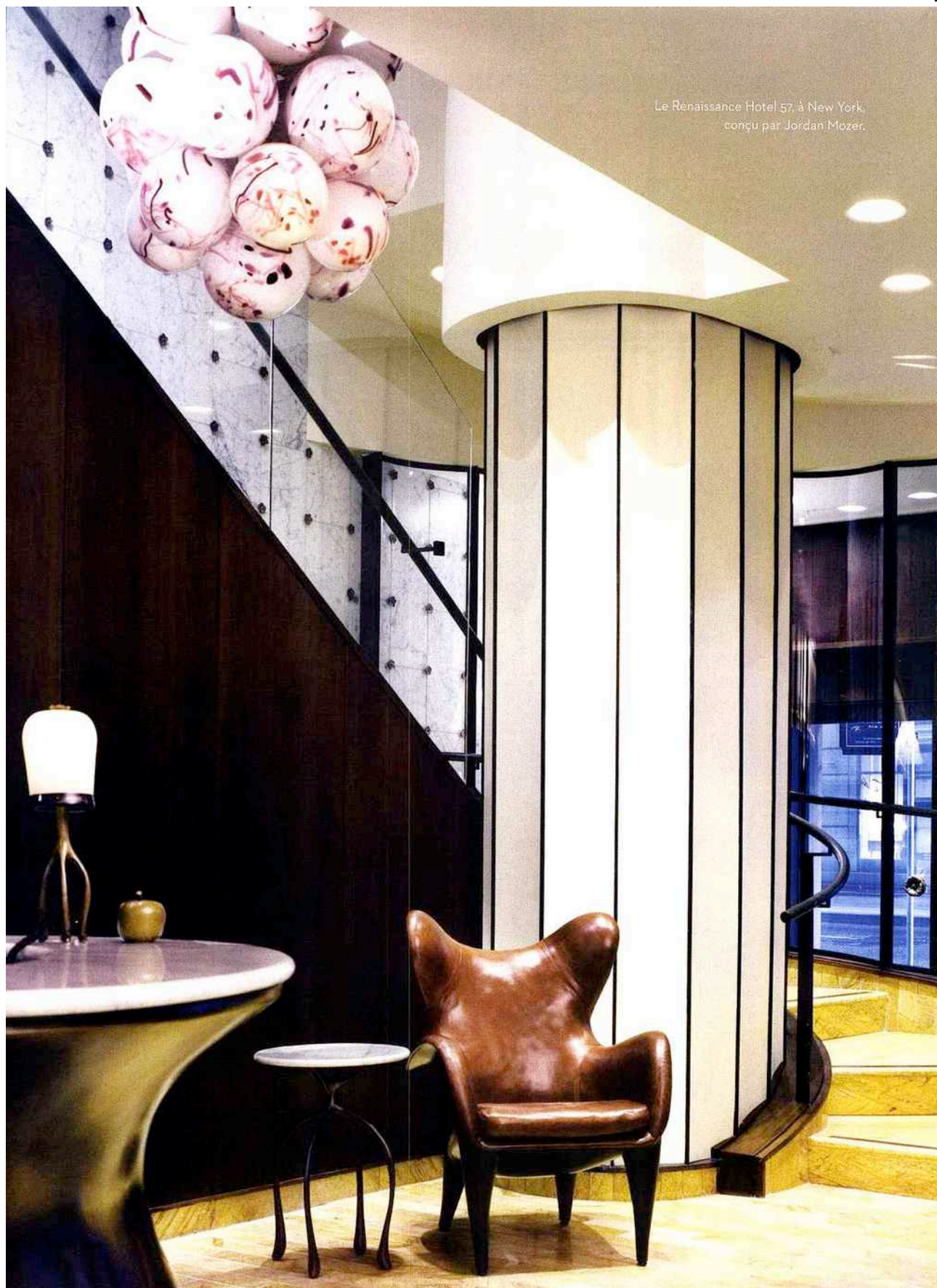
Le Renaissance Hotel 57, à New York, conçu par Jordan Mozer.